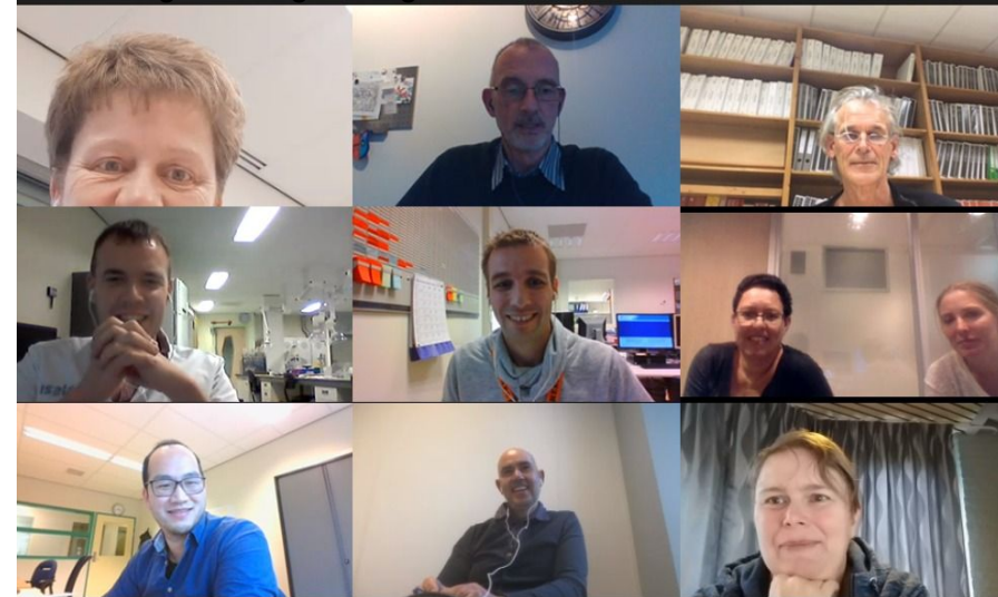
Digitale vergadering met commissies november 2020