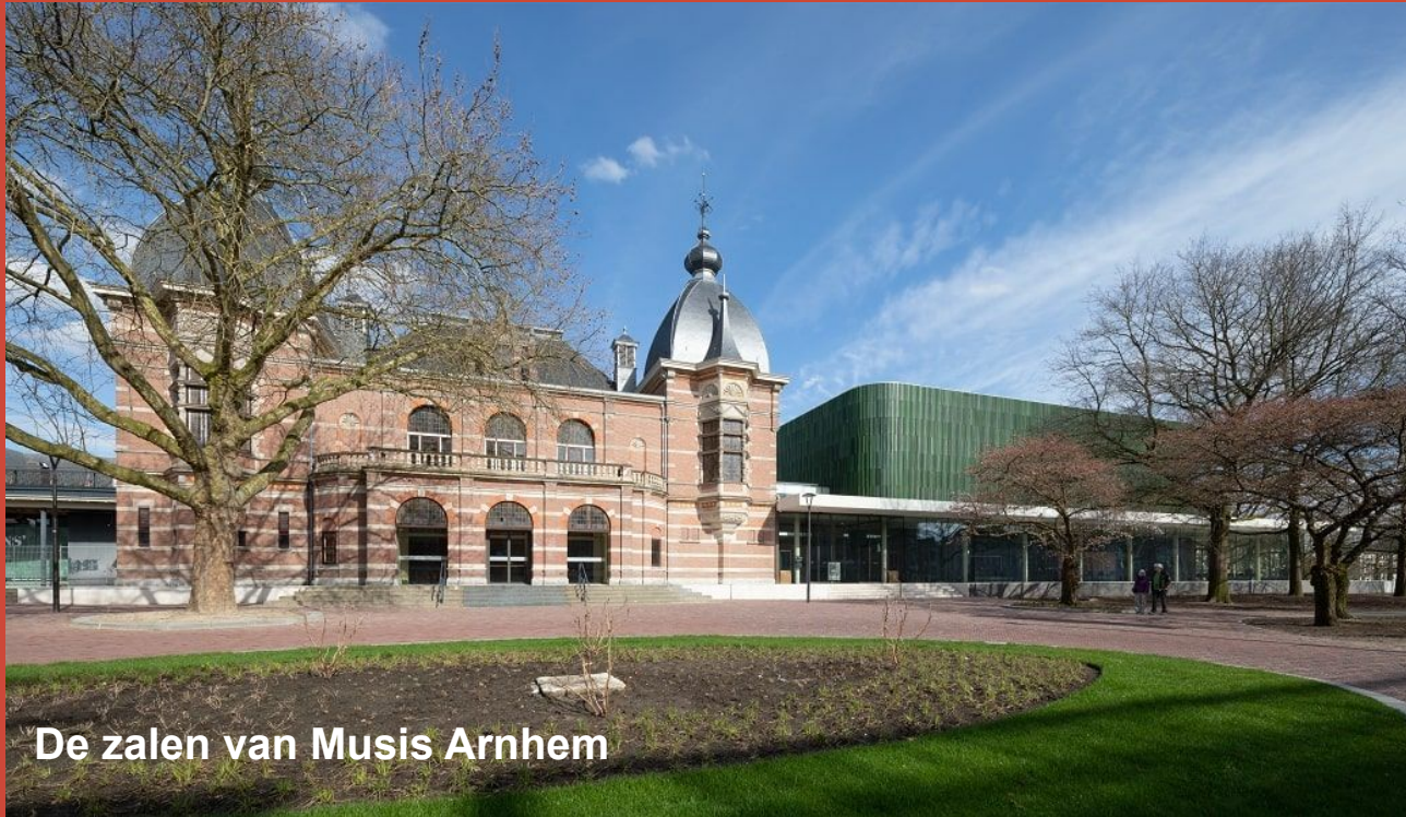
De zalen van Muis Arnhem