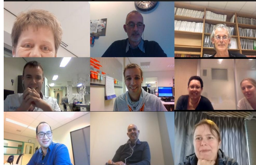
Digitale vergadering met commissies november 2020